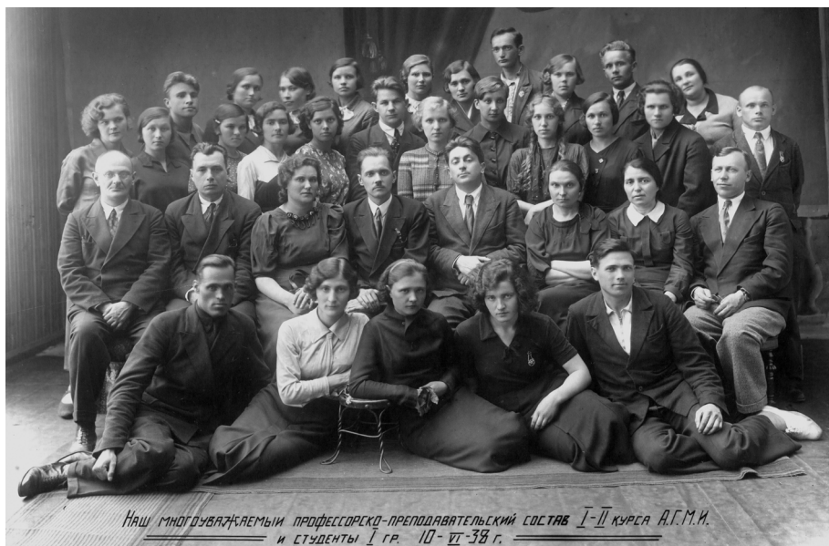
Наш многообразный профессорско-преподавательский состав I-II курса АГМИ и студенты I гр. 10-11-38 г.