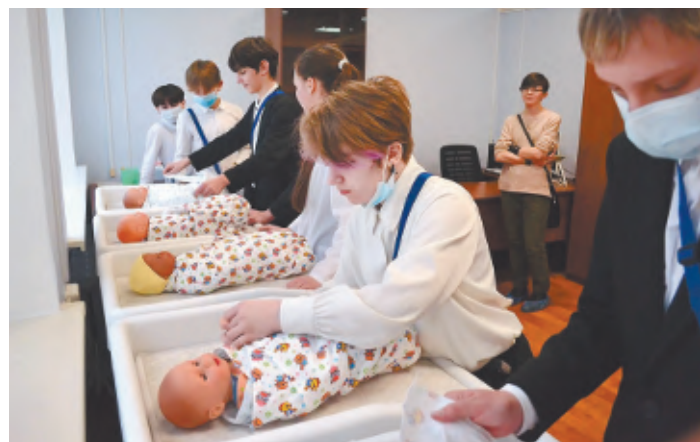
Экскурсия и мастер-классы в медколледже очень востребованы у школьников