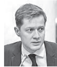
Александр Герштанский, министр здравоохранения Архангельской области:

– Важно помнить, что жизнь и благополучие ребенка всегда в первую очередь находится в руках родителей. Поэтому необходимо ответственно относиться к репродуктивному здоровью и заранее планировать беременность. У жителей Архангельской области есть возможность пройти репродуктивную диспансеризацию. Записаться на бесплатное обследование можно и через региональный контакт-центр 122.