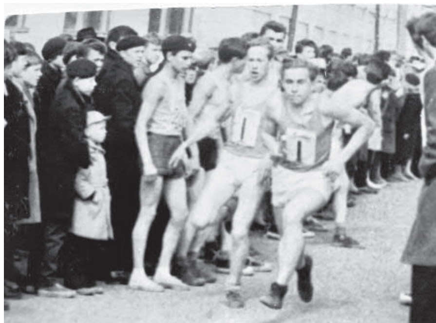
Майская эстафета 1964 года.